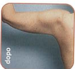
braccia: 3 mesi dopo, significativa contrazione tissutale