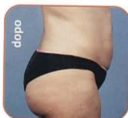
addome e fianchi: 3 mesi dopo